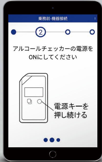
アルコール検知器協議会認定品

タブレット・スマートフォンにBluetoothペアリングでデータ管理 測る・見る + 通信機能のアルコール検知器