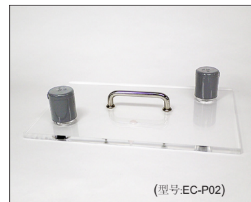
带供气与排气口的箱盖

费加罗技研株式会社 大阪府箕面市船場西1-5-11 邮编: 562-8505 电话: 81-72-728-2044 URL: www.figaro.co.jp/cn/